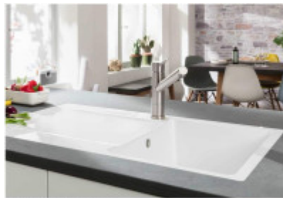
Abbildung: Siluet 50 in Weiß (Ableit) Dieses Schüsselbild ist beispielhaft. Alle Illustrationen stellen nur die Seite der Artikelbeschreibung dar.