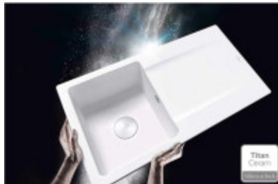
Titan Ceram - Der Werkstoff der Zukunft! Die Eigenschaften hochwertiger Keramik mit außergewöhnlicher Festigkeit vereint. Titan Ceram ermöglicht kreislaufende flüssige Formen.