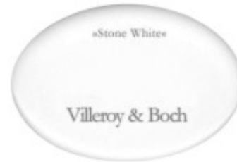
Rein weiße Seifenschalen aber Einschüsse auf farbiger Grundfarbe - matt Die Abbildung ist stark vergrößert (Originalgröße: 65 mm x 40 mm)